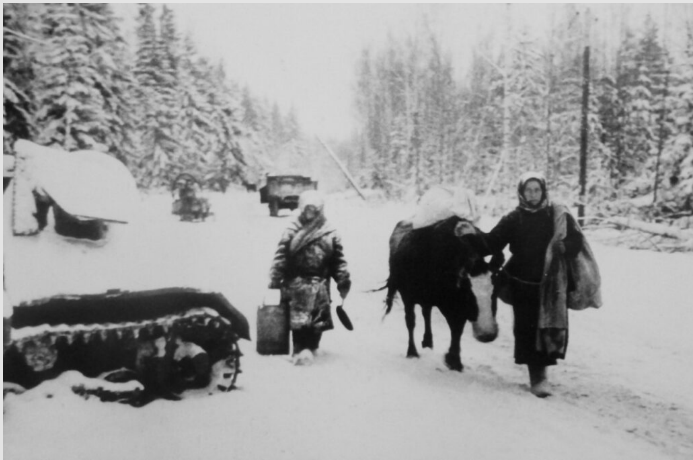
Беженцы с коровой на дороге под Тихвином

30 октября немецкие войска вступили на территорию Волховского района.