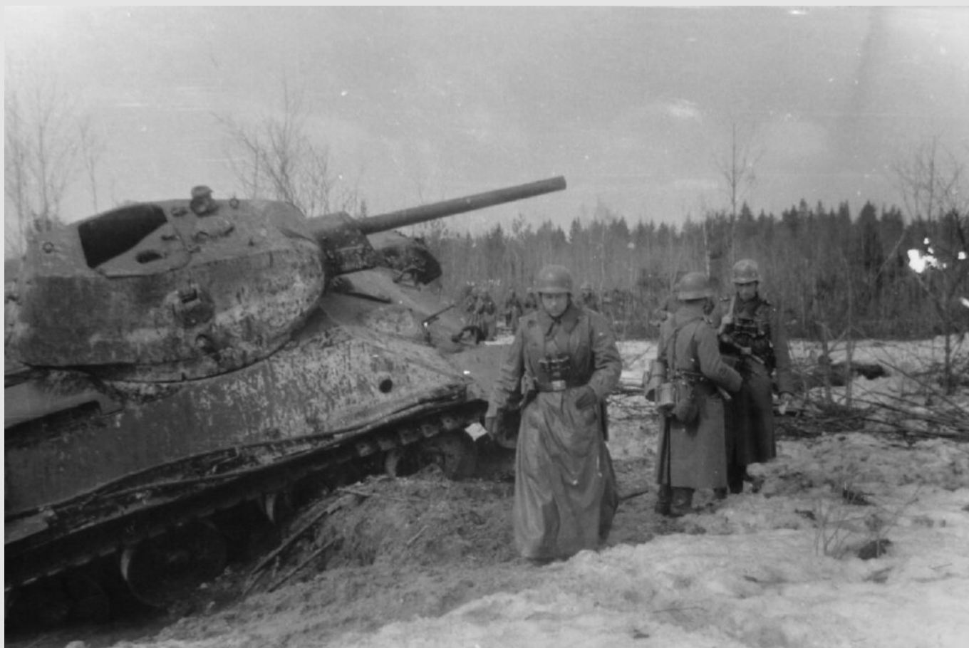
Солдаты 18-й моторизованной дивизии вермахта идут мимо подбитого советского танка Т-34 в районе Тихвина